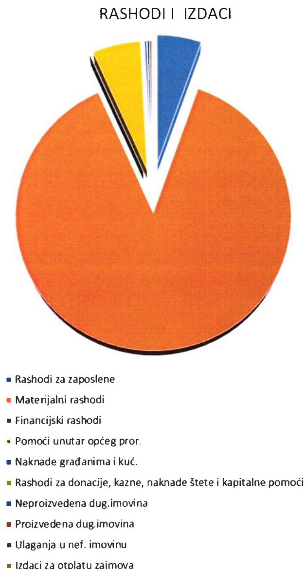
Grafikon 2: Struktura rashoda i izdataka Drugih izmjena i dopuna Financijskog plana za 2025. godinu prema ekonomskoj klasifikaciji