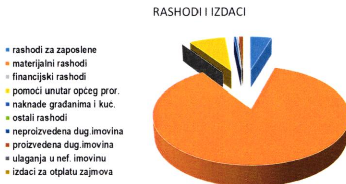
Grafikon 2: Struktura rashoda i izdataka Prvih izmjena i dopuna Financijskog plana za 2024. godinu prema ekonomskoj klasifikaciji